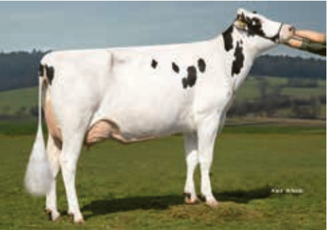
Supergirl, Agrargen. Hörseltal e.G., Burla

DE 03 59736504 aAa 234156 geb.: 10.04.2017